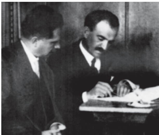
Александр Шульгин (читает документ) в должности министра иностранных дел УНР, 1929 г.

Хотя смерть Петлюры и стала сильным ударом, деятельность сторонников УНР на эмиграции не прекратилась. Наоборот, наблюдается объединение и слаженность действий центров УНР в Европе. Не последнюю роль сыграла позиция Польши, правительственные деятели которой, по возвращению Юзефа Пилсудского к власти в мае 1926 года, решили восстановить военнополитическое сотрудничество Украины и Польши, заложенное в 1920 году 9 . После убийства Петлюры власть перешла к главе Рады министров УНР – Андрею Ливицкому. Члены правительства УНР находились в разных странах Европы. Сам Андрей Ливицкий с большей частью своего кабинета министров пребывал в Польше, в то время как Шульгин с 1927 года жил в Париже. Кроме того, ему было поручено редактирование еженедельника «Тризуб» полуофициального органа УНР на эмиграции, который выходил в Париже.