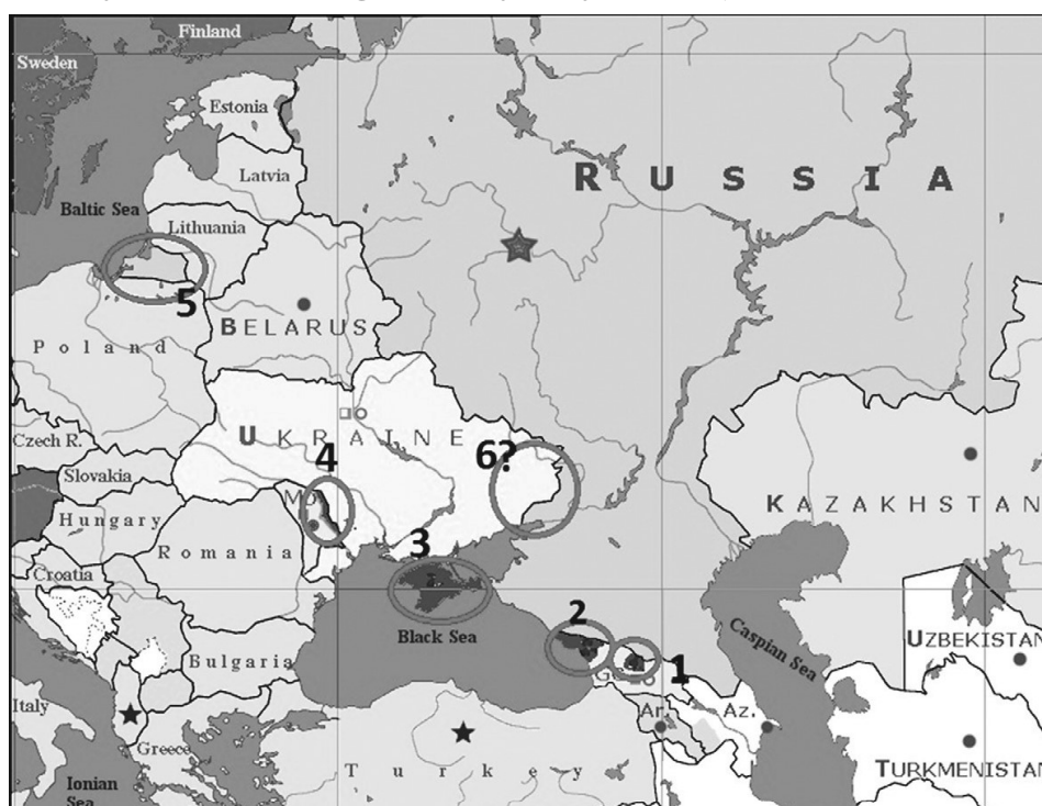
1 – Osetia Południowa; 2 – Abchazja; 3 – Krym; 4 – Naddniestrze; 5 – Obwód Kaliningradzki; 6 – Ukraina wschodnia i południowo-wschodnia.